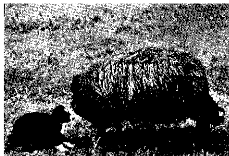
□ Valptester har visat sig effektiva inom färdhundssaveln. (Ur Svenskt Hundlexikon).