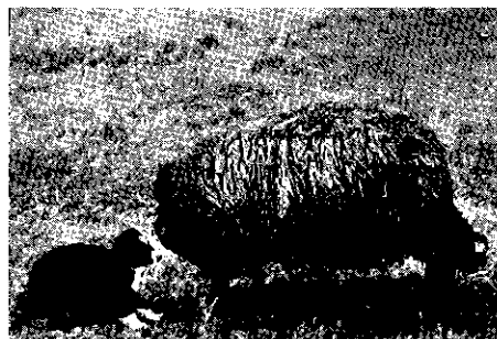
□ Valptester har visat sig effektiva inom färhundsaveln. (Ur Svenskt Hundlexikon).