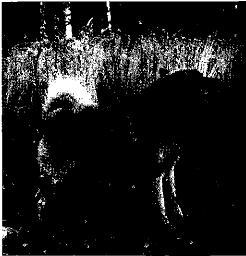
□ Så såg han ut — Metsämiehen Penu eller "Gammel-Penu" som han också kallades.