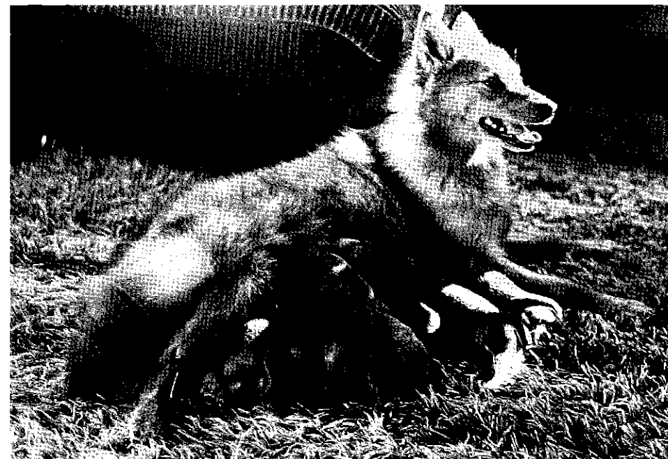
□ Isku och hennes rekordkull — sju valpar.