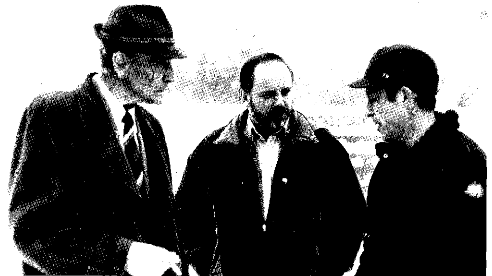
□ Där vitsipporna normalt skulle ha stått i blom låg snön tjock på utställningsdagens morgon och varma ytterkläder fick plockas fram. I mitten SSF:s nye sekre-