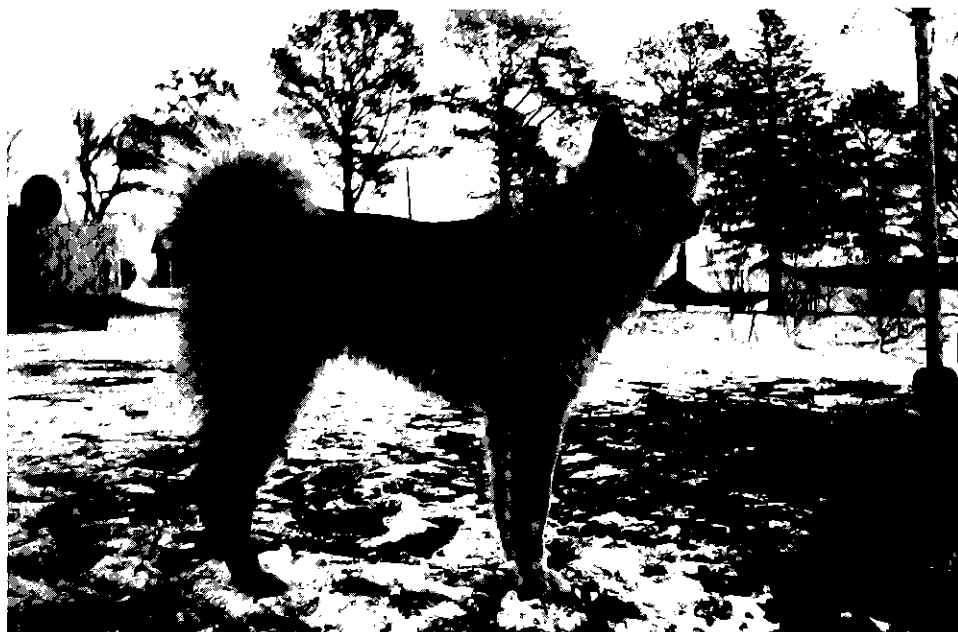
• Fångsjödalens Kirre