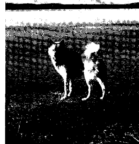
• Friesgårdens Tikka