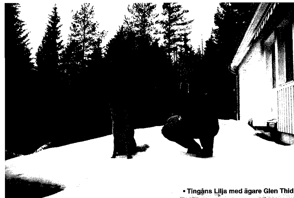
• Tingåns Lilja med ägare Glen Thid