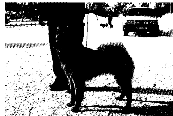
• SUCH SJCH Rippe, ägare Kjell Rosberg, blev Best in show på Robertsforsutställningen 31 januari