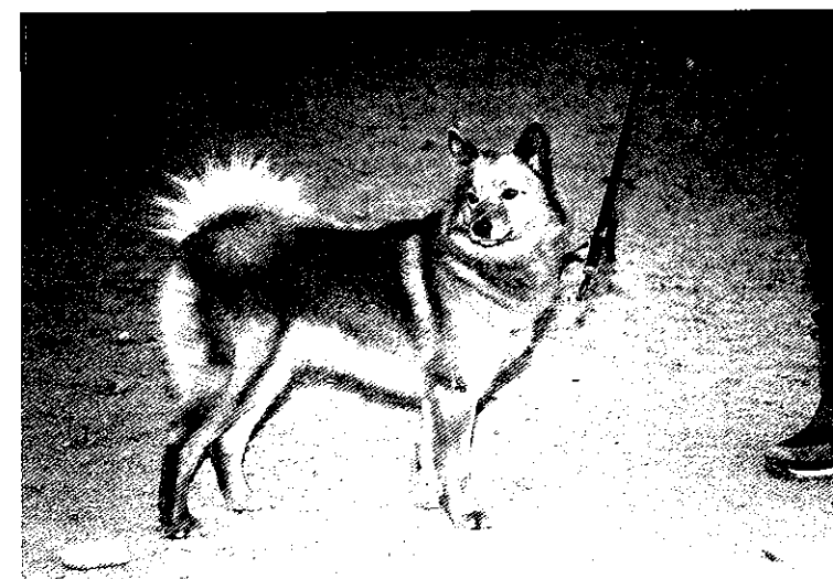
• Bis hunden Tjäderdalens Söppö.