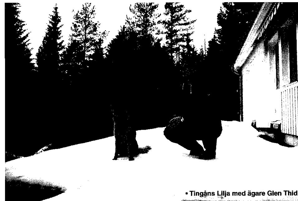
• Tingåns Lilja med ägare Glen Thid