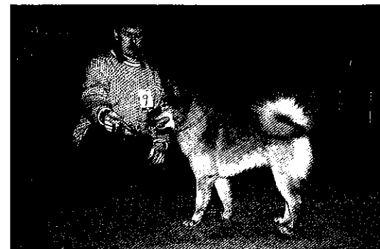
• Bir och Bishunden Tapperdalens Vicke