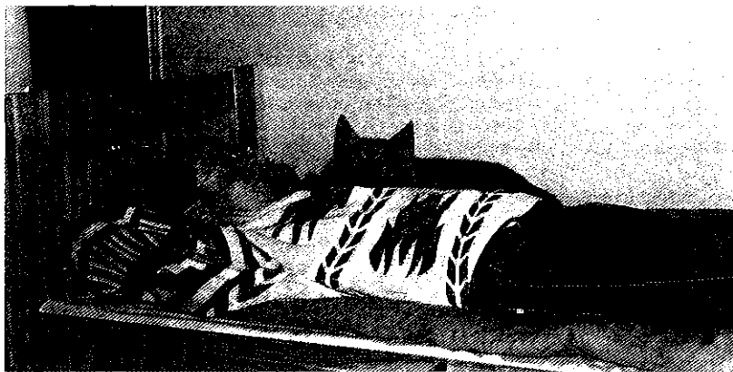
• Per-Erik och Pexy i funderationer. Skall dagens jobb räcka?