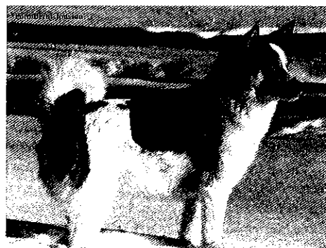
SJCH Morstobäckens Tuvali